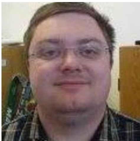
😬 FUTTE 😬