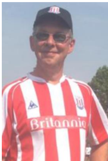
😬 STOKE 😬

😊 LUNDS TIPSPFORENING ønsker tillykke med det flotte resultat og Held og Lykke 😊