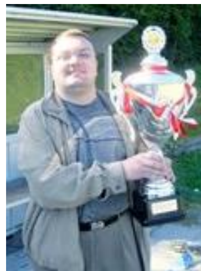
😬 LIONS 😬

😬 STOKE var kun et mulehår fra, at komme i Kamp om Liga Cup'ens 3. Plads, men kravet var uafgjort i den sidste kamp og det glippede, så STOKE måtte se i øjnene, at det ikke blev i denne omgang, at dette skulle lykkes. STOKE havde sågar chancen for at komme i Liga Cup Finalen, men det havde krævet en stor-sejr i den sidste kamp. Så STOKE var lige ved og næsten, men er færdig i årets Liga Cup 2021 😬 FUTTE fik sin første sejr her i den sidste kamp men da var løbet kørt. FUTTE har ellers i 2018 præsteret en flot 3. plads her i Liga Cup'en, men det er forbi for denne gang 😬 LIONS fra den samme FUTTE -familie fulgte jo traditionen tro Mesteren lige i hælene og det blev til en sløj omgang med kun én sejr i den sidste kamp. LIONS har ellers familiens bedste papirer, med 2. pladsen i Liga Cup'en 2018. Men her i Liga Cup 2021 gik den ikke længere 😬