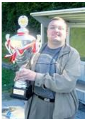
🙄 LIONS 🙄

😊 BRAY er debuterende signatur i Danmarksturneringens 3. division, men er dog under ledelse af top-tipperen CORK fra den bedste række. Så det var i opgøret mod LIONS, ikke muligt at udpege en favorit og der var lagt op til et hårdt opgør. BRAY lagde ud som lyn og torden og fremførte en suveræn super-score i den 1. kamp og da LIONS havde dumpe-score, var der virkelig smæk for skillingen. BRAY kunne dog ikke lige følge op på det hårde udlæg og efter en uafgjort kamp, måtte BRAY indkassere et nederlag i den 3. kamp og dermed var der lagt op til en meget spændende 4. kamp. I den 4. kamp kørte BRAY den sikre stil og da LIONS kiksede lidt, var den samlede sejr hjemme til BRAY og dermed billetten til ¼-Finalen 😊 LIONS røg ud i 2. runde i 2020 og klarede sig trods alt bedre i år, men Pokal'en er forbi for denne gang 🙄