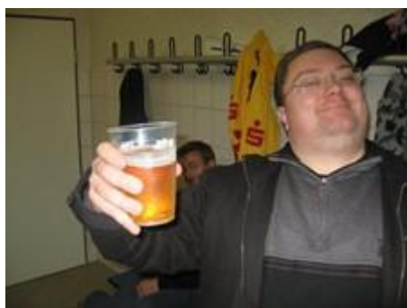
😊 DEVILS 😊

😊 DEVILS og LIONS kommer begge fra den store velkendte tips-familie, hvor FUTTE er overhovedet. Begge tippere er jo opdraget til at følge de nøjagtig samme retningslinjer, så et internt møde vil aldrig kunne blive andet end uafgjort, hvilket også bliver tilfældet i denne kamp, der ifølge reglerne fortsætter, indtil der er spillet 4 kampe. Herefter kommer de yderliggående regler i brug og det ender i sidste instans med, at førstnævnte tipper går videre og det betyder at DEVILS , vinder dette maraton-opgør i Liga Pokalen. Scoren specielt i den første kamp er aldeles imponerende og der er virkelig format over tegnene fra denne stor-familie. Så DEVILS videre til Liga Pokal'ens 2. runde, efter fintælling i alleryderste led 😊 LIONS er ude af Liga Pokal'en efter en marginal-afgørelse 🙄