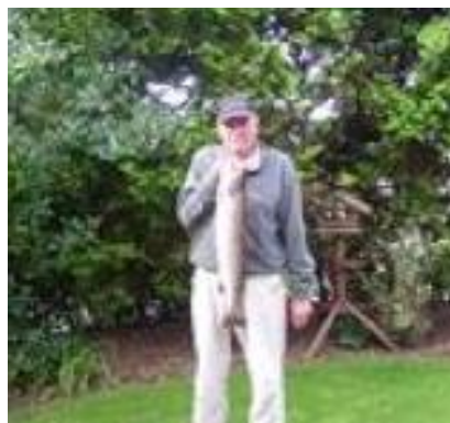
😊 VIPTIP 😊

😊 KAILUA har haft en forrygende Liga Cup her i den indledende runde og med 3 sejre og 2 uafgjorte kampe, havde KAILUA længe før den sidste kamp, sikret sig en billet til Mellemrunden. Så KAILUA blev en særdeles sikker vinder af denne pulje og en velfortjent billet til Mellemrunden er uddelt. SPVK skulle bruge et enkelt point i den sidste kamp, for at være helt sikker på en billet til Mellemrunden, så SPVK spillede på det sikre og hev det ene point hjem og 2. pladsen i puljen var dermed hjemme og adgangsbilletten til Mellemrunden var sikret. VIPTIP lå lige under stregen før sidste kamp, i et meget tæt felt, men med sejren i den sidste kamp mod CANARY , der ellers lå over stregen, overtog VIPTIP puljens sidste billet og VIPTIP er hermed klar til Mellemrunden 😊