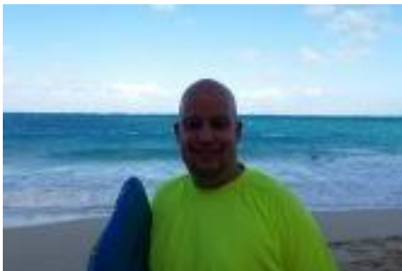
😊 KAILUA 😊