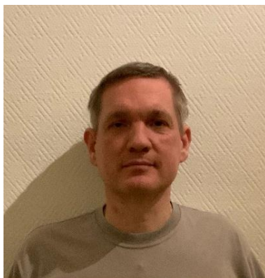
😊 AMIGO 😊