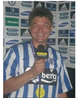
😊 ANDERUP 😊