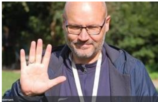
😊 NISSE 😊