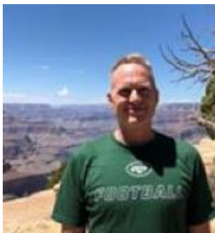
🙄 MARSCHA 🙄

😊 IDSKOV foreningens formand, der frister en tilværelse tæt på bunden i Liga ´ens bedste række, er altid god for overraskelser og sandelig om ikke IDSKOV lige fyrer en serie af på 4 sejre og 1 uafgjort her i Mellemrunden og resultatet blev en særdeles suveræn puljesejr, milevidt fra nærmeste konkurrent. Nåh ja, det er jo også Liga Cup – Mesteren 2004 og 2019 vi har med at gøre her. Så en stensikker billet til IDSKOV til Semifinalerunden 😊 AMIGO comeback-tipper gør ikke så meget væsen af sig i Liga ´ens 3. division, men her i Liga Cup ´en lykkedes det for AMIGO , at hive en flot 2. plads hjem i denne pulje. AMIGO var dog hårdt presset lige til det sidste og selv om det kun blev til uafgjort i den sidste kamp, var det en sikker billet til Semifinalerunden, der blev uddelt til AMIGO 😊