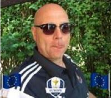
😊 MORAN 😊

debutant, var i fare lige til det sidste og der skulle et enkelt point til i den sidste kamp, for at være helt sikker, men NISSE tabte mod puljevinderen AMIGO, men alligevel flaskede det hele sig for NISSE og billetten til Mellemrunden kom i hus 😊 FAXE levede livet farligt lige til det sidste og der skulle en sejr til i den sidste kamp, for at være sikker på videre deltagelse, men FAXE fik en ordentlig en på hatten, men heldige omstændigheder gjorde, at FAXE lige netop blev på den rigtige side af stregen og dermed hev en billet hjem til Mellemrunden 😊