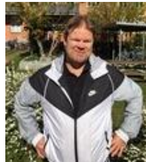
😊 FAXE 😊