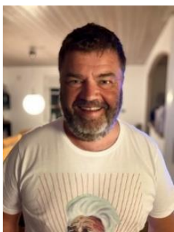
🙄 BORRIS 🙄