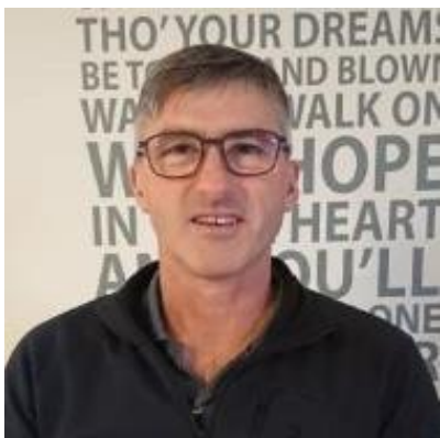
😊 IDSKOV 😊