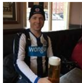
🙄 MAGPIES 🙄

🙄 MARSCHA fra 1. Liga ´s bedste halvdel, havde chancen lige til det sidste i det direkte opgør mod AMIGO , men da begge havde super-score her blev det kun til et enkelt point til hver og det var ikke nok for MARSCHA , der med en sejr ville være gået videre, men sådan skulle det ikke være og MARSCHA der blev Liga Cup – Mester i 2014, måtte gå den tunge gang ud af Liga Cup ´en for denne gang 🙄 BORRIS debutant fra Liga ´ens 3. division, havde chancen lige til det sidste, men en ordentlig lussing i den sidste kamp, gjorde det af med alle forhåbninger og BORRIS er færdig i årets Liga Cup for denne gang 🙄 NIELSEN der balancerer på stregen i Liga ´ens 1. division, havde ikke den store succes her i Liga Cup ´ens Mellemrunde, hvor NIELSEN dog sluttede af med maner og en kæmpe-sejr, men Liga Cup ´en er forbi for denne gang 🙄 MAGPIES debutant fra midten af 3. Liga ´s midterfelt, var sat af allerede inden den sidste kamp og MAGPIES må konstatere, at der skal mere til end 3 uafgjorte kampe, hvis man vil have en billet til næste runde. Så Liga Cup ´en er forbi for denne gang 🙄