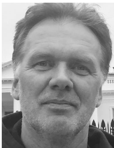
😊 LUFCMOT 😊

😊 LUFCMOT er debutant i turneringen og det var på forhånd svært at fremsætte en favorit i dette opgør, hvor modstanderen er den herlige velkendte X-tipper LUCKY, der i denne sæson er godt med i toppen af 2. division. LUFCMOT var dog godt tippende i den 1. kamp, hvor LUFCMOT havde en pæn egenscore og det kunne LUCKY ikke hamle op med og i den 2. kamp var det de små marginaler der gjorde udslaget, men LUFCMOT var dog lige en lille tand bedre og er hermed videre til Pokalturneringens 2. runde 😊 I sidste sæson røg LUCKY ud i 2. runde, men i denne sæson sluttede Pokalturneringen efter 1. runde for LUCKY 🙄