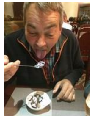
🙄 LUCKY 🙄