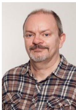
👤 SPVK 👤