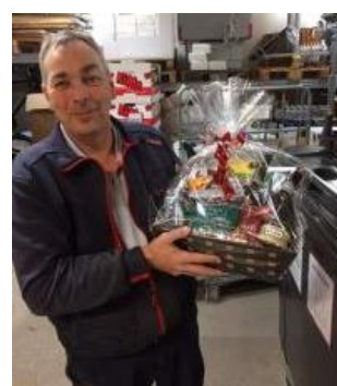
👤 LUCKY 👤

👤 SPVK fra toppen af Liga ´ens 2. division, havde på papiret, med en sejr, gode chancer for at komme over stregen i den sidste kamp og SPVK gjorde hvad han skulle og hev en stor-sejr hjem, men alligevel trak SPVK det korte strå og billetten glippede efter fintælling, så Liga Cup ´en er slut for denne gang 👤 AGGER der ligger lige over stregen i Liga ´ens 2. division, førte puljen an inden den sidste kamp og AGGER havde det ene ben i Semifinalerunden, men et uheldigt nederlag i den sidste kamp og trods en fin egenscore, blev det skæbnesvangert for AGGER , der hermed røg ned under stregen og helt ud af Liga Cup ´en. En hård omgang for AGGER der blev nr. 3 i Liga Cup ´en 2020 og endvidere blev Liga Cup – Mester i 2015 👤 AYA fra bunden i Liga ´ens 3. division, var sat af allerede inden den sidste kamp og AYA må se i øjnene, at Liga Cup ´en er forbi for denne gang 👤 LUCKY fra Liga ´ens 2. division, var heller ikke for godt kørende og det blev ikke til det helt store, så LUCKY takker også af her i Liga Cup ´en 2021 👤