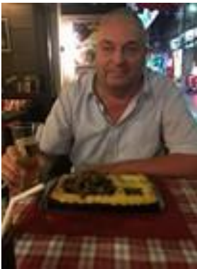
😊 BØLLE 😊

😊 BØLLE der jo ellers havde tænkt sig at gå på pension her i Liga ´en ta ´r lige en sæson mere og så kan man jo lige så godt vise flaget. Ingen af tipperne BØLLE eller LUCKY har tidligere vist evner her i Liga Pokal ´en, hvor de begge røg ud efter 1. runde i sæson 2020. BØLLE er familiens frække hund, der ikke altid tipper som resten af familien og det gav pote her i kampen, hvor BØLLE fremviste en score over gennemsnittet og det medførte en kæmpe-sejr til BØLLE og en meget sikker billet til Liga Pokalen ´s 2. runde 😊 LUCKY der holder til i Liga ´ens 2. division satsede forkert i den pågældende spilleuge og det medførte en rigtig dumpe-karakter og afsked med Liga Pokalen for denne gang 🙄