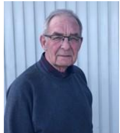
🙄 BRULA 🙄