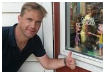
👤 TYNDE 👤