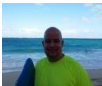
👤 KAILUA 👤