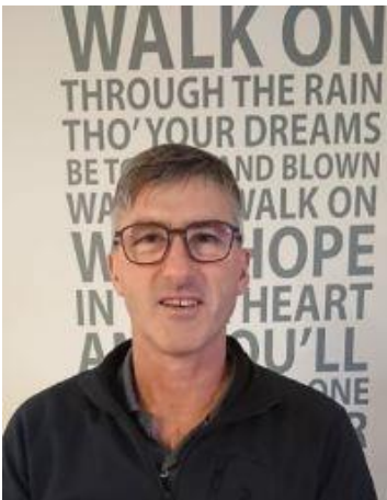
😊 MIKKEL 😊

😊 MIKKEL der ellers huserer i bundfeltet af den bedste LIGA-række, var trods alt favorit her i opgøret mod BRULA fra den tunge ende af Liga ´ens 2. division. MIKKEL har tilbage i 2010 hentet en flot 3. plads hjem her i Liga Pokalen og i 2020 nåede MIKKEL frem til ¼-Finalen, så rimelig fine papirer blev vist frem her. MIKKEL mødte dog uventet hård modstand og det lykkedes BRULA, at hente uafgjort hjem i den 1. kamp og dermed fremtvinge endnu en kamp, men her var der ingen tvivl og MIKKEL hentede en stor-sejr hjem og er dermed videre til Liga Pokalen ´s 3. runde 😊 BRULA må se i øjnene, at det er slut i Liga Pokalen for denne gang her efter 2. runde 🙄