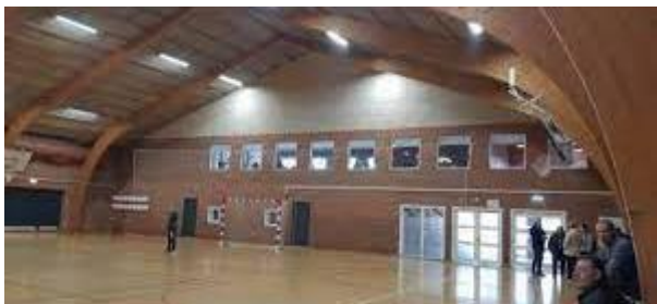
Båndby-Hallen i Storvorde

Hertil kan lægges titler som æresborger i Storvorde-Sejlflod og ambassadør for Dansk Boldspil-Union. Det er også blevet til hædersnåle fra Sejlflod Kommune og Dansk Firmaidrætsforbund.