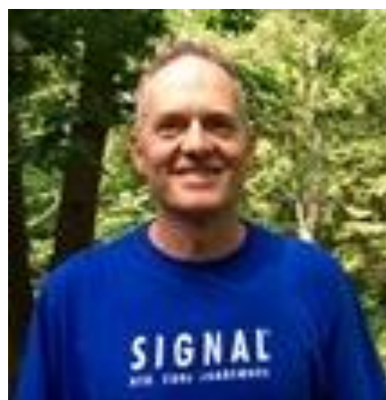
😊 MARSCHA 😊