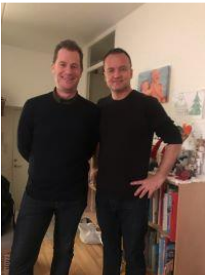
🙄 HÅRVARD 🙄