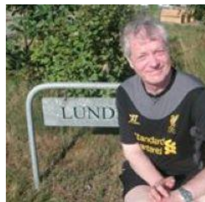
😊 ZICO 😊