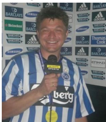
🍀 ANDERUP 🍀

😊 ZICO den gamle LUND – veteran fra den bedste række mødte her debutanten ANDERUP fra Danmarksturneringens 3. division og ZICO var absolut storfavorit i opgøret, men som det fremgår blev det alligevel til et hårdt opgør over fire kampe. Efter en nervøs uafgjort kamp, satte ZICO trumf på og udraderede ANDERUP i den 2. kamp og alle troede at opgøret hermed var afgjort, men så viste ANDERUP lige evnerne i den 3. kamp og så var der pludselig uventet ligestilling igen. Men i den 4. kamp viste ZICO lige de gamle Pokal-evner tilbage fra det herrrens år 1985, hvor ZICO blev Pokal-Mester og så var den samlede sejr hjemme for ZICO , der hermed fik en adgangsbillet til Pokal ´ens 3. runde 😊 ANDERUP fik vist flaget og det blev trods alt til en hæderlig præstation, men Pokal ´en er forbi for denne gang 🍀