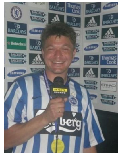
🙄 ANDERUP 🙄

🙄 HÅRVARD havde det ene ben i Mellemrunden og skulle kun bruge et enkelt point i den sidste kamp for at være sikker på videre deltagelse. Men HÅRVARD kunne ikke stå for presset og det fatale nederlag betød, at HÅRVARD sluttede under stregen og er færdig i Liga Cup 'en for denne gang. MURER havde kun præsteret to uafgjorte kampe inden rundens sidste kamp og var uden chance for at gå videre, men MURER sluttede dog af med maner og sejrede i den sidste kamp, men det var for sent, løbet var kørt. Debutanten ANDERUP opnåede kun to uafgjorte kampe og var ikke rigtig med i denne pulje og Liga Cup 'en er forbi for ANDERUP 🙄