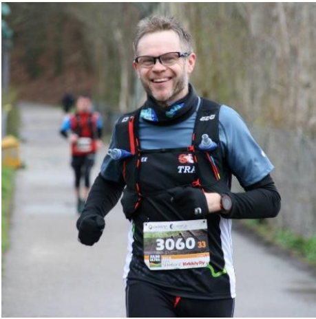
😊 NIELSEN 😊