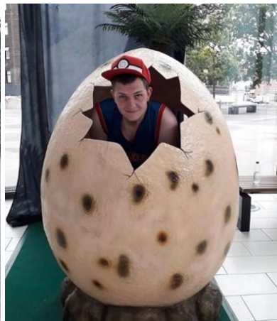
🐹 CHELSEA 🐹