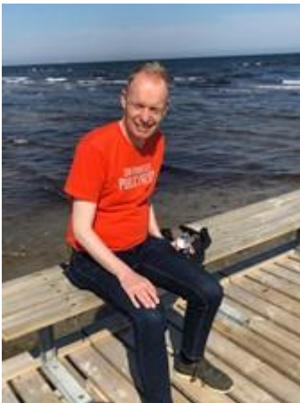
🙄 FOX 🙄

😊 NIELSEN fra toppen af den bedste LIGA-række, var storfavorit her i opgøret mod veteranen FOX, der huserer i den nedre halvdel af Liga ´ens 2. division. FOX har dog opnået Liga Pokal – Mesterskaber i 2005 og 2013, men NIELSEN kan også fremvise to Liga Pokal – Mesterskaber i årene 2015 og 2019 og NIELSEN jagter nu det 3. Liga Pokal – Mesterskab. NIELSEN gav den da også fuld skrue her i den afgørende spilleuge og fremviste en superscore og hermed en stor-sejr over FOX. Så NIELSEN er nu blandt de 8 bedste og er klar til Liga Pokal ¼-Finalen 😊 FOX er stadig flot repræsenteret på Liga Pokalen ´s Top 3 – Evighedstabel, men det bliver ikke til mere i denne omgang 🙄