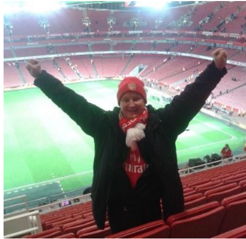
😊 GUNNERS 😊