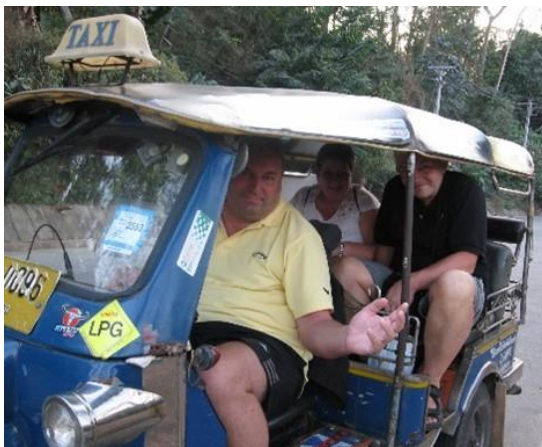
🐹 BAMSE 🐹