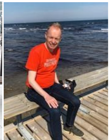
🐹 FOX 🐹

🐹 BAMSE der var LIGA Cup – Mester i 2007 havde inden den sidste kamp, en mikroskopisk chance for at komme over stregen, men det lykkedes ikke og BAMSE kommer ikke på Liga Cup skamlen i denne sæson. CHELSEA har faktisk præsteret en flot 2. plads i Liga Cup 2012, men i denne sæson var der langt op til denne succes-historie, for med kun to point i de første fire kampe, var løbet kørt før den sidste kamp, så selv om CHELSEA vandt denne, var det for sent og Liga Cup ´en er forbi for CHELSEA for denne gang. Veteranen FOX har tidligere præsteret en flot 2. plads i 2009 og en 3. plads i 2013, så jagten på den helt store Liga Cup – triumf var sat ind, men med kun 1 point i de 5 kampe, så blev det dog tværtimod til en meget tynd omgang for FOX , der hermed er ude af turneringen 🐹