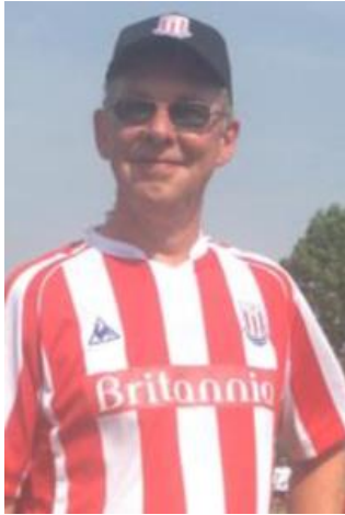
😊 STOKE 😊