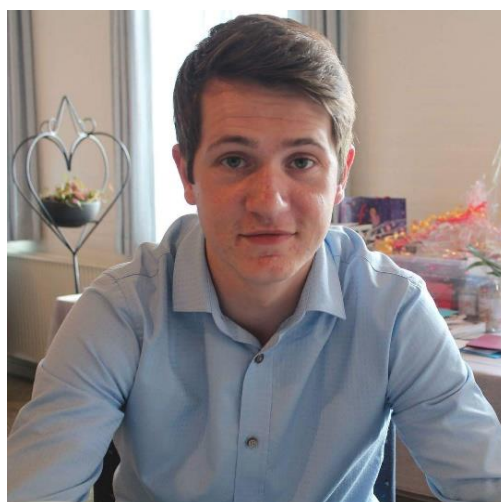
😊 MANUTD 😊