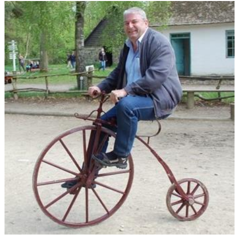
😊 NUSER 😊

😊 STOKE debutant har været godt kørende her i Liga Cup ´en og allerede inden den sidste kamp, var billetten til Mellemrunden sikret for STOKE , der i den sidste kamp tog det så stille og roligt, at han tabte, men alligevel holdt STOKE fast i førerpositionen. Så en fornem billet til Mellemrunden er hermed uddelt til STOKE . Det var debutanten GUNNERS , der besejrede STOKE i den sidste kamp og dermed kom GUNNERS op lige i hælene på puljevinderen. GUNNERS var ikke 100% sikret inden den sidste kamp, men en flot afslutning sikrede GUNNERS en billet til Mellemrunden. NUSER var sikret en billet inden den sidste kamp og en sikker billet til Mellemrunden var hjemme 😊