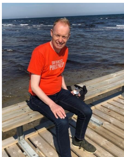
🤔 FOX 🤔

😊 MANUTD den debuterende tipper fra Færøerne, var på forhånd ikke levnet en jordisk chance mod den forsvarende Pokal-Mester 2020 FOX, der også blev Pokal-Mester i 2016. Ikke uventet hev FOX i den 1. kamp en sejr hjem i varmen og kursen var lagt, men så kom debutanten MANUTD ind i kampen og præsterede to uafgjorte kampe i træk og derefter gjorde MANUTD kort proces i de to næste kampe og den hidtil største sensation i Pokalturneringen 2021 var en realitet. MANUTD har allerede bestået svendepøven og foreningen ønsker tillykke med det flotte resultat 😊 FOX den forsvarende Pokal-Mester er stadig dybt chokeret over det uventede exit fra årets Pokalturnering 🤔