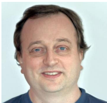
🙄 ARSENAL 🙄

😊 PERCY der efter en pause gør comeback her i Pokal'en, mødte en af de største profiler ARSENAL fra den bedste række og var ikke levnet en chance. ARSENAL blev nr. 4 i Pokal'en i sidste sæson og selv om PERCY tilbage i 2010 blev nr. 3 i Pokal'en, var der vist ikke mange der satsede pengene på PERCY . Men allerede fra start viste PERCY overraskende god styrke ved at spille lige op med ARSENAL i de to første kampe og så en beskedent sejr i den 3. kamp og pludselig var der uventet stor spænding og alle troede det var en enkelt smutter for ARSENAL, men sandelig om ikke PERCY stor-sejrede i den 4. kamp og dermed vippede stærke ARSENAL ud af turneringen, - en sensation af de større og en fabelagtig præstation af PERCY , der hermed er videre til Pokal'ens 3. runde 😊 ARSENAL må chokeret konstatere, at Pokal'en 2021 er færdig her efter 2. runde 🙄