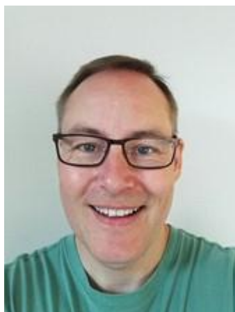
🙄 FLINCA 🙄