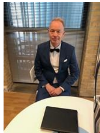
🙄 PIQUET 🙄