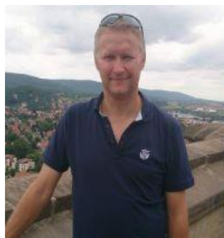
🙄 FOREST 🙄