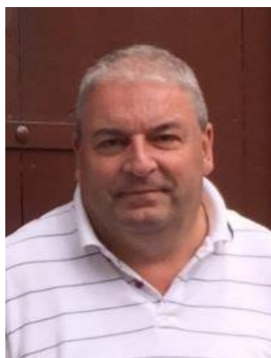
😊 NUSER 😊

😊 NUSER fra bunden af den bedste LIGA-række mødte her divisions-kollegaen DEVILS, der dog fører sig frem omkring midten af rækken. Et spændende opgør, uden en egentlig favorit. NUSER har dog vundet LIGA POKALEN tilbage i 2006, så det vil NUSER naturligvis gerne prøve igen. Opgøret blev det eneste i 3. runde, der trak ud i 3 kampe førend der blev fundet en afgørelse. Først 2 hårde uafgjorte kampe, men så tog NUSER stikket hjem med en smal sejr i den 3. kamp og dermed indløste NUSER en billet til LIGA Pokalen ´s ¼-Finale 😊 DEVILS må se i øjnene, at det er slut i LIGA Pokalen for denne gang 🙄