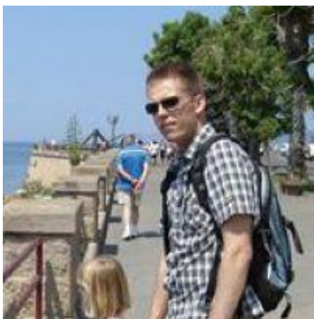
🙄 SIR S 🙄

😊 VINDING var ude i en rigtig gyser-kamp mod kollegaen SIR S, der lige som VINDING huserer i den bedste LIGA-række. Modstanderen SIR S var jo den forsvarende LIGA POKAL – Mester, så der var lagt op til en hård kamp. VINDING egenscore var ikke prangende, men trods alt rigtig fin og det hele fusede lidt ud, da SIR S lige netop i denne spilleuge fremviste en kedelig bundscore, så VINDING fik en aldeles sikker sejr i hus og sendte hermed den forsvarende LIGA POKAL – Mester ud af turneringen og VINDING er nu i ¼-Finalen 😊 SIR S må se i øjnene, at der ikke er plads til down-uger her i LIGA POKALEN, hvor det er knald eller fald. Slut for denne gang for SIR S 🙄