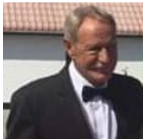
😊 VINDING 😊