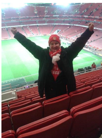
😊 GUNNERS 😊

😊 GUNNERS der er debutant i turneringen og til daglig frister en tilværelse under midterstregen i 3. Liga, var her kommet på en meget hård opgave mod veteranen FOREST og favoritværdigheden var absolut på FOREST ´s side. Men lige netop på spilledagen var GUNNERS i hopla og fyrede en super-score af og da FOREST ikke rigtig var oppe i samme gear, blev det til en stor-sejr til GUNNERS , der nu er videre blandt de 8 bedste Liga Pokal – tippere og klar til ¼-Finalen 😊 FOREST må meget skuffet konstatere, at det er slut i Liga Pokalen for denne gang 🙄