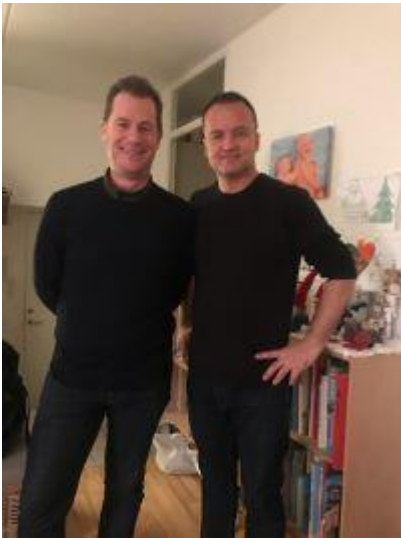
😊 TØFTING 😊

sig at være nok til en sejr, da MANUTD fejlede lidt i scoren i lige netop denne spilleuge. Så TØFTING der røg ud i 2. runde i sidste sæson kan nu prøve lykken endnu en gang her i sæson 2020 😊 MANUTD må konstatere, at formen skal være bedre, hvis man skal have succes her i Liga Pokal'en og det er slut for denne gang 🙄