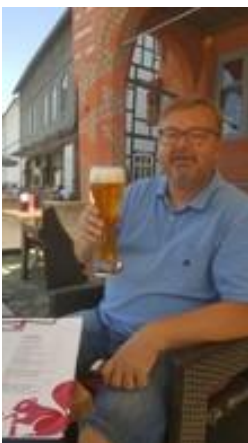
🙄 HEDE 🙄

😊 PIQUET fra Liga ´ens 2. division, var klar favorit i dette opgør mod debutanten HEDE der er startet op i Liga ´ens 3. division. PIQUET røg ud i 2. runde i sæson 2020, men her i denne sæson er det i hvert fald startet bedre op og selv om scoren ikke var prangende, så fik PIQUET hentet en sejr hjem, da HEDE dykkede lidt i scoren, lige netop i den pågældende spilleuge. Så PIQUET fik udleveret en billet til Liga Pokal ´ens 2. runde 😊 HEDE må her i debut-sæsonen erkende, at kravene for succes her i Liga Pokalen, er betydelig højere end HEDE havde regnet med. Så Liga Pokalen er forbi for HEDE for denne omgang 🙄