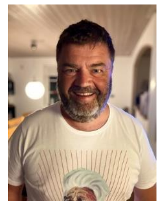
👎 BORRIS 👎