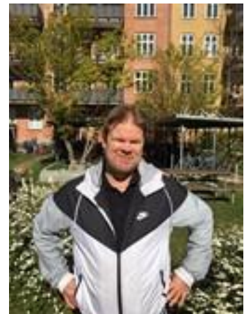
😊 FAXE 😊