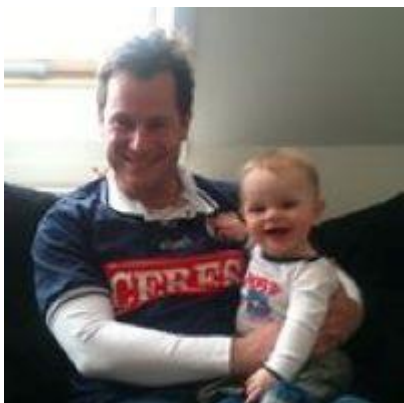
🙄 HÅRVARD 🙄

😊 FOX fra 2. Liga er veteran i turneringen og havde den naturlige favoritværdighed her i opgøret mod HÅRVARD fra samme række. FOX har meget fine papirer fra Liga Pokalen, hvor det er blevet til Liga Pokal – Mesterskaber i årene 2005 og 2013. I sidste sæson røg såvel FOX som HÅRVARD dog ud i 1. runde. FOX fik dog ikke sejren foræret, for efter en hård uafgjort kamp, måtte der en ekstra kamp til for at finde en afgørelse. Her var der til gengæld ingen tvivl og FOX hev her en sikker sejr hjem og har dermed sikret sig adgang til Liga Pokal ´ens 2. runde 😊 HÅRVARD der ellers er top-tipper i Liga ´ens 2. division, røg for 2. sæson i træk ud i 1. runde 🙄