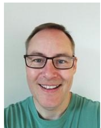
😊 VINDING 😊