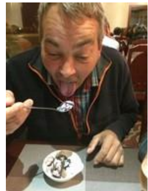
🙄 LUCKY 🙄