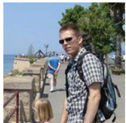
😊 SIR S 😊

Der var 6 opgør mellem tippere fra Liga´ens 1. division og 3. division: