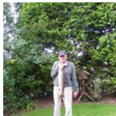
🙄 VIPTIP 🙄

Der var 7 opgør mellem tippere fra Liga's 1. division og 2. division: