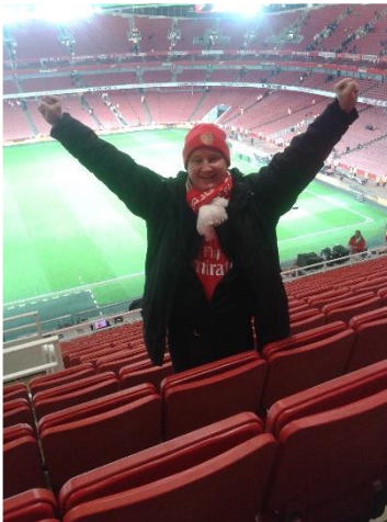
😊 GUNNERS 😊

😊 GUNNERS der er debutant i Liga ´ens 3. division, var ikke levnet en chance mod den rutinerede BAMSE fra toppen af den bedste række. GUNNERS viste dog de rette tips-evner på det rigtige tidspunkt. GUNNERS præsterede en flot score over gennemsnittet og det var mere end BAMSE kunne fremvise, så en meget overraskende sejr til debutanten GUNNERS , der hermed er videre til Liga Pokal ´ens 2. runde 😊 BAMSE røg ud i 2. runde i sidste sæson og har ellers stolte traditioner i Liga Pokal ´en med et Liga Pokal – Mesterskab i 2007 og en 3. plads i 2004. Men her i sæson 2021 slukkede lyset for BAMSE efter 1. runde 👎