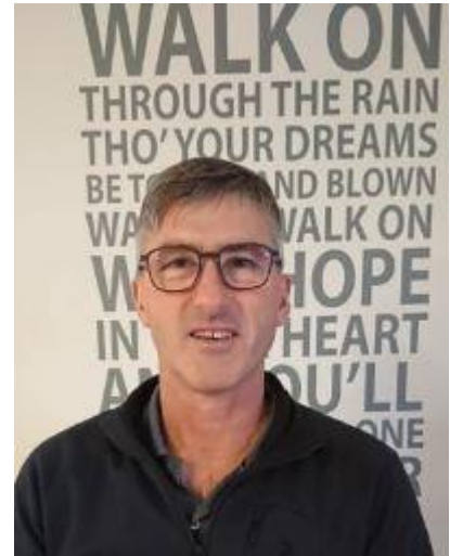
🙄 CULOPIP 🙄