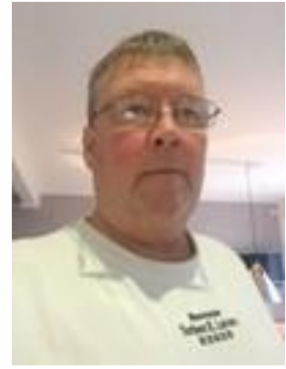
😊 MURER 😊