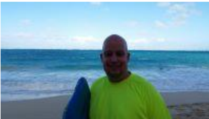
👤 KAILUA 👤

😊 SIR S fra den bedste Liga-række er jo den forsvarende Liga Pokal – Mester fra 2020 og her i opgøret mod KAILUA fra 2. Liga, ville alt andet en end sejr til SIR S være en stor sensation. SIR S fik da også hevet sejren hjem, men det var bestemt ikke på imponerende vis. Sejren kom kun hjem, fordi modstanderen KAILUA havde dumpe-score lige netop i spilleugen. SIR S forsvarede dog titlen i første omgang og er videre til Liga Pokal´ens 2. runde 😊 KAILUA har ellers en flot 2. plads fra 2018 på CV´et, men må igen lige som sidste sæson konstatere, at Liga Pokal´en er forbi efter 1. runde 👤