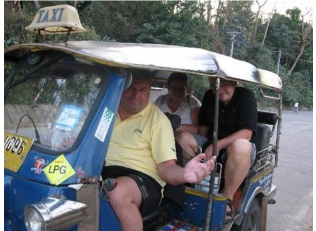
👎 BAMSE 👎