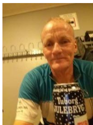
😊 AGGER 😊

😊 AGGER fra den nedre halvdel af Liga ´ens 2. division mødte her NANDO fra samme nedre halvdel, så en egentlig favorit var det på forhånd svært at udpege. Dog fremgår det, at NANDO ´s egenscore er betydelig bedre end NANDO ´s. I den første kamp blev det ikke overraskende uafgjort, men i den efterfølgende kamp var dagsformen hos AGGER lige en tand bedre og AGGER fik hermed hentet en billet hjem til videre deltagelse i Liga Pokalen ´s 2. runde 😊 NANDO nåede frem til 3. runde i sæson 2020, men her i sæson 2021 var Liga Pokalen forbi for NANDO allerede i 1. runde 🙄