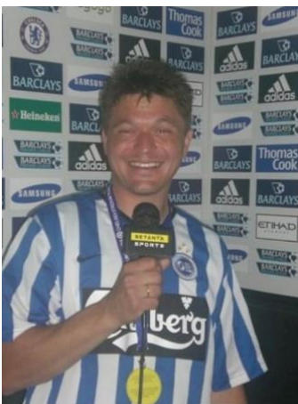
🙄 ANDERUP 🙄

😊 FAXE der er i gang med sin 2. sæson her i turneringen og allerede nu er i 2. Liga, var favorit mod ANDERUP, der debuterer i Liga ´ens 3. division. I sidste sæson røg FAXE ud i 1. runde, men det gik bedre i denne sæson, selv om FAXE ikke imponerede, men havde en middel-score, men det var nok mod ANDERUP der havde en score under middel. Så FAXE er nu for første gang videre i Liga Pokal ´ens 2. runde 😊 ANDERUP må se i øjnene, at der skal mere til for at få succes her i turneringen, - det er i hvert fald slut for denne gang 🙄