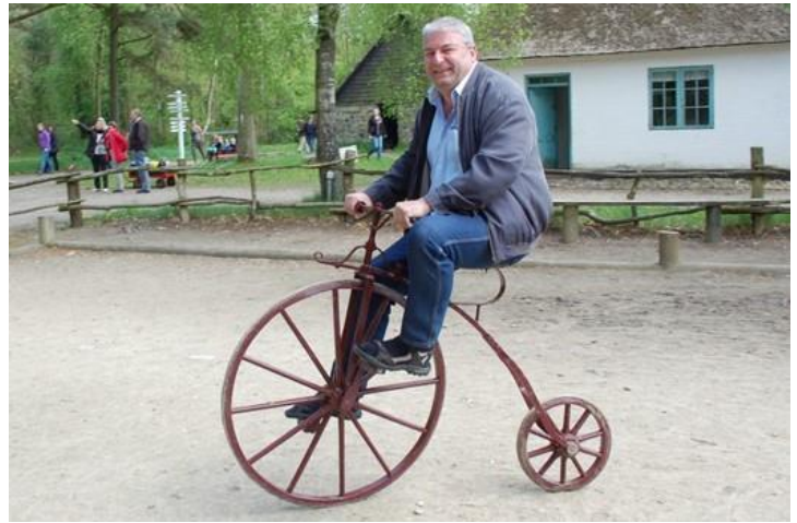
😊 NUSER 😊