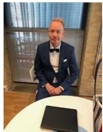
😊 PIQUET 😊

Oversigt over tipperne der er klar til Liga Pokalens 2. runde: