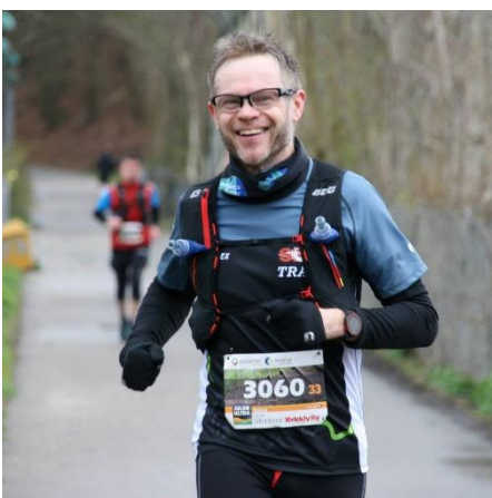
😊 NIELSEN 😊

😊 NIELSEN var storfavorit i dette opgør mod SPURS fra 2. Liga, i kraft af Liga Pokal – Mesterskaber i 2015 og 2019 og den øjeblikkelige gode placering i toppen af Liga ´ens bedste række. Selv om NIELSEN overraskende røg ud i 1. runde i sæson 2020, ville alt andet end en sejr her være overraskende. NIELSEN præsterede dog ikke nogen imponerende score, men en lidt tynd præstation fra SPURS , betød at NIELSEN alligevel rendte af med sejren og dermed en billet til Liga Pokal ´ens 2. runde 😊 SPURS må se i øjnene, at Liga Pokal ´en igen i år er forbi efter 1. runde 👤