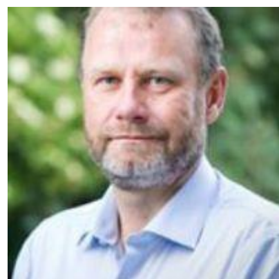
🙄 CANARY 🙄