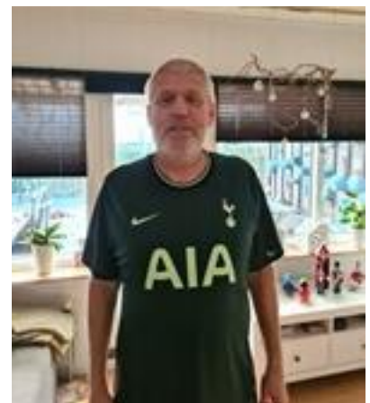
👤 SPURS 👤