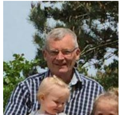
👤 BENBO 👤