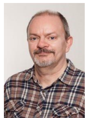
😊 SPVK 😊