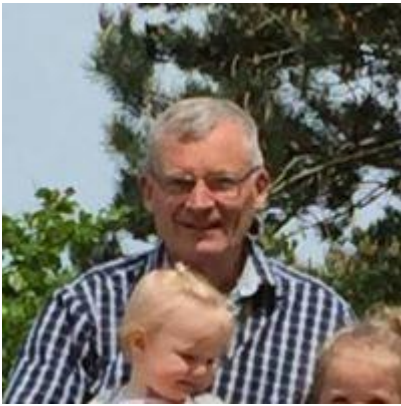
👍 FRYDKÆR 👍