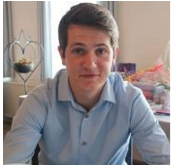
🙄 MANUTD 🙄