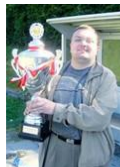
🙄 LIONS 🙄