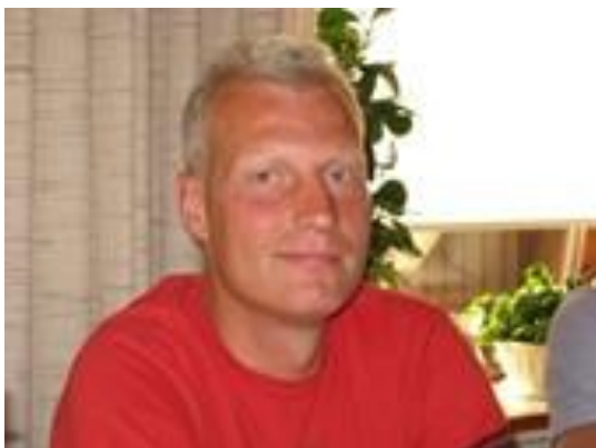
😊 SCHØN 😊

😊 SCHØN fra den bedste Liga-række var favorit i dette opgør i kraft af den højere divisions-status, men intet var på forhånd sikkert, idet modstanderen STEAM er kendt for meget svingende tipning, så dagsformen havde bestemt også stor betydning. Begge tippere blev slået ud i 1. runde i sæson 2020. I den første kamp havde begge tippere rundens middel-score, så der måtte endnu en kamp til for at afgøre opgøret. SCHØN havde en score under middel, men det betød ikke noget, for STEAM` s score var endnu dårligere, så SCHØN hev en billet hjem til Liga Pokal`ens 2. runde 😊 STEAM må konstatere, at satsningerne i den 2. kamp slog fejl og at det er slut i Liga Pokal`en for denne gang 🙄