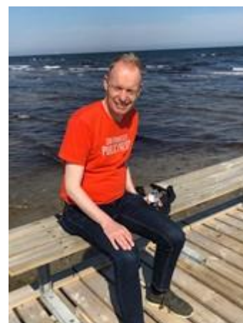
😊 FOX 😊