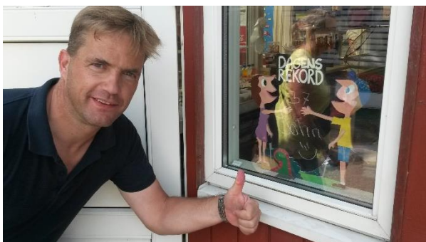
🙄 TYNDE 🙄

😊 MANUTD den debuterende unge færøske tipper, var ude i et maraton-opgør i de maximale 7 kampe der kan spilles og modstanderen var TYNDE fra toppen af den bedste række. De 6 af kampene sluttede uafgjort, men i den 5. kamp hev MANUTD en spinkel sejr hjem og det var nok for MANUTD til en samlet sejr og en overraskende billet til Pokalturneringens 2. runde. En rigtig flot præstation af MANUTD 😊 TYNDE der ellers nåede frem til 3. runde i sidste års Pokalturnering, må se i øjnene at det er slut for denne gang 🙄