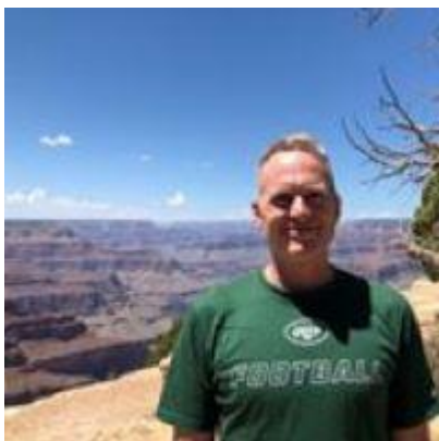
🙄 ENYA 🙄

😊 SPVK der er nedrykker fra den bedste række i sidste sæson, mødte den debuterende signatur ENYA fra Danmarksturneringens 3. division. Bagmanden bag ENYA er dog velkendt, så opgøret virkede meget åbent. SPVK nåede i sidste sæson 2020 helt frem til kvartfinalen. SPVK tog dog ingen chancer og sørgede for at hive en storsejr hjem i den 1. kamp, men så gav debutanten ENYA igen og sejrede i den 2. kamp, så det hele var stadig åbent, da man skulle spille 3. kamp. Her var SPVK dog en lille tand bedre og SPVK hev hermed den samlede sejr hjem og hermed en billet til Pokalturneringens 2. runde 😊 ENYA må i stedet koncentrere sig om kampen i Danmarksturneringens 3. division, - Pokal ´en 2021 er hermed forbi for denne gang 🙄