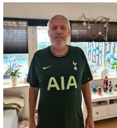
🏆 SPURS 🏆

VIPTIP (2) – TOFFEE (1): (5 – 5, 8 – 9, 7 – 5, 2 – 4):