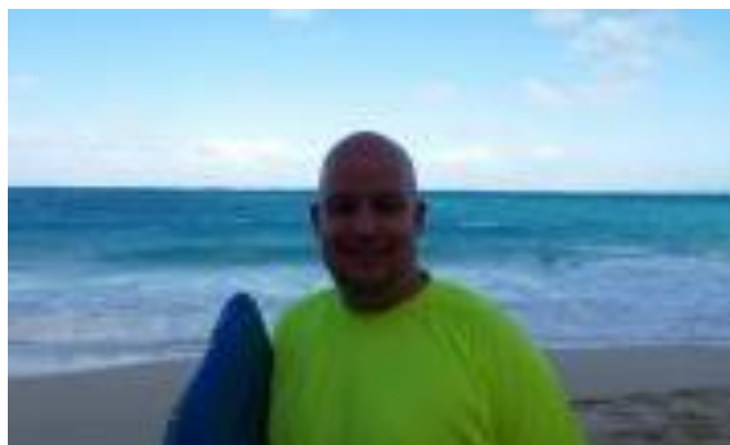
😊 KAILUA 😊

DERBY (2) – FUTTE (1) : (5 – 5, 8 – 9, 6 – 5, 3 – 4):