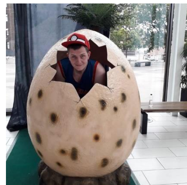
😊 CHELSEA 😊