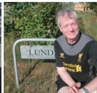
😊 ZICO 😊