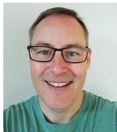
🙄 FLINCA 🙄