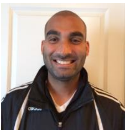
🙄 AYA 🙄

😊 MAGPIES er debutant i turneringen og deltager derfor i Danmarksturneringens 3. division og modstanderen AYA huserer en række højere oppe og i kraft af denne højere status og i kraft af at AYA i 2020 nåede helt frem til kampen om 3.- og 4. pladsen og kun var et mulehår fra at komme på den fornemme Pokalturnering Top 3 – Evighedstabel, var AYA klar favorit. MAGPIES tog dog ingen notits af AYA 's fine papirer og gik fra start hårdt til den og gav AYA en ordentlig dukkert allerede i den 1. kamp. AYA prøvede at komme sig over dette udlæg og præsterede da også et par uafgjorte kampe, men så måtte AYA modtage endnu en dukkert og hermed en meget sikker samlet sejr til MAGPIES , der hermed er videre til Pokalturneringens 2. runde 😊 AYA meget overraskende ude af Pokal'en 2021 allerede efter 1. runde 🙄