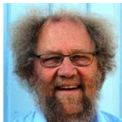
🙄 STEAM 🙄

SOFUS (3) – CHELSEA (2): (5 – 5, 9 – 9, 4 – 6, 3 – 4):