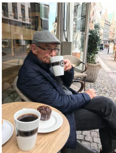
😊 FYFFE 😊

😊 FYFFE der er ny tipper i Danmarksturneringens 3. division debuterer her i Pokalturneringen, men har dog velkendte BRULA til at trække i trådene. Modstanderen AGGER var på grund af den højere divisionsstatus udpeget som favorit i opgøret. Det skulle dog vise sig at blive et maraton-opgør. Efter et forsigtigt udlæg med uafgjort, hev FYFFE en overraskende sejr hjem i den 2. kamp og havde dermed fordelen, men efter to efterfølgende uafgjorte kampe, var det pludselig AGGER der vandt en kamp og så var stillingen helt lige igen og man troede at AGGER så ville gøre arbejdet færdigt i den næste kamp, men her overraskede FYFFE igen og med en beskeden sejr blev FYFFE den endelige vinder af opgøret og er hermed videre til Pokalturneringens 2. runde 😊 AGGER må konstatere at han lige som i 2020 røg ud af Pokal'en efter 1. runde, men dog efter en god kamp og med æren i behold 🙋