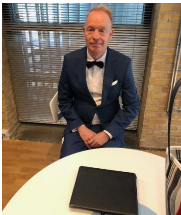
😊 PIQUET 😊

😊 PIQUET der i denne sæson gør comeback i den bedste række og fører sig godt frem i toppen af rækken, mødte her VINDING fra Danmarksturneringens 2. division. PIQUET der figurerer på den fornemme Pokalturneringens Top 3 – Evighedstabel i form af en 3. plads i 2018, var storfavorit i opgøret. PIQUET lagde da også ud med en beskeden sejr i den 1. kamp, men så viste VINDING lige, at han trods alt også kan være med og det blev til to uafgjorte resultater inden PIQUET igen fik hevet en beskeden sejr hjem i varmen i den 4. kamp og hermed en klar forbedring for PIQUET , der røg ud i 1. runde i 2020. Så en billet til 2. runde her i Pokal´en 2021 til PIQUET 😊 VINDING der sidste år røg ud i 2. runde, må efter en god kamp og god præstation, se sig ude af årets Pokalturnering 🙄