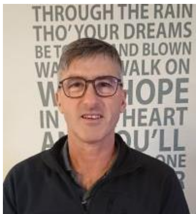
😊 IDSKOV 😊

😊 IDSKOV fra den bedste række har opnået fine præstationer her i Pokalturneringen. På Pokal-CV'et er der to 2. pladser og to 3. pladser, men lige nøjagtig Pokal-Mesterskabet mangler som en af de få turneringer IDSKOV endnu ikke har vundet. Her i opgøret mod SPURS fra 2. division, troede IDSKOV det ville blive en nem opgave, men det blev i stedet til et maraton-opgør. Efter uafgjort i den første kamp, hev SPURS en stor-sejr hjem og IDSKOV var hermed under et enormt pres, men den rutinerede formand fik hevet en beskeden sejr hjem i den tredje kamp og så fortsatte SPURS med at spille lige op med favoritten IDSKOV og først i den 6. kamp lykkedes det IDSKOV at hive en smal samlet sejr hjem 😊 SPURS havde chancen og kæmpede fantastisk, men måtte alligevel se i øjnene, at Pokalturneringen 2021 var færdig for denne gang 🏆