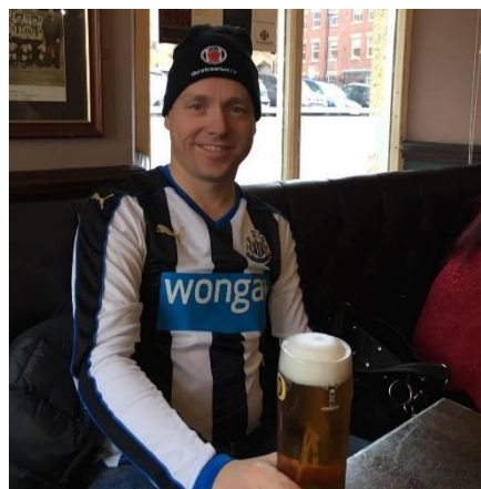
😊 MAGPIES 😊