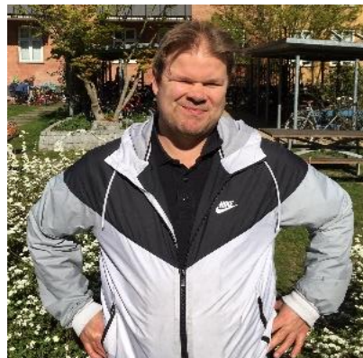
🙄 FAXE 🙄

NORWICH (1) – NISSE (3): (5 – 6, 8 – 8, 5 – 7):