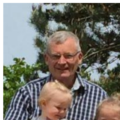
😊 FRYDKÆR 😊