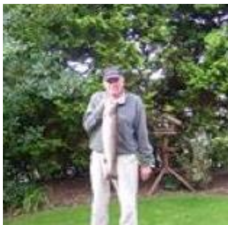
😊 VIPTIP 😊

😊 TOFFEE fra toppen af den bedste række, var favorit i opgøret mod VIPTIP fra den bedre halvdel i Danmarksturneringens 2. division. TOFFEE røg i sæson 2020 dog ud allerede i 1. runde og VIPTIP røg først ud i 2. runde. I den 1. kamp lagde de blødt ud med et uafgjort resultat til følge. I den 2. kamp hev TOFFEE lige en smal sejr hjem og havde dermed et godt udgangspunkt til den 3. kamp. Men den uberegnelige tipper VIPTIP, ved man aldrig hvor man har og VIPTIP stod for en tordnende stor-sejr i den 3. kamp og havde dermed chancen for en match-bold i den 4. kamp, men her fik VIPTIP satset lidt for meget og TOFFEE med de rimelig sikre tegn, vandt en stor-sejr og hev hermed den samlede sejr hjem og en billet til Pokalturneringens 2. runde 😊 VIPTIP var tæt på og lige ved, men måtte dog konstatere, at det var slut i Pokal'en for denne gang 🏆