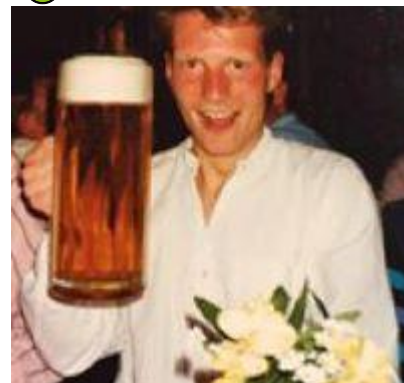
🙋 SCHØN 🙋

Der var otte opgør mellem tippere fra 2. division og 3. division: