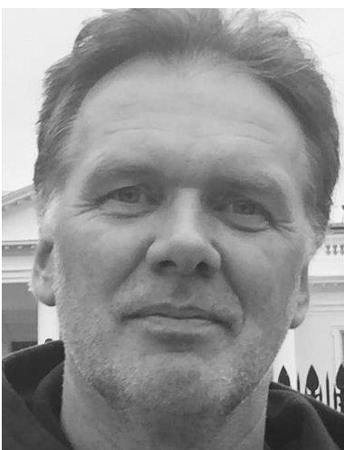
😊 LUFCMOT 😊

😊 LUFCMOT er debutant i turneringen og det var på forhånd svært at fremsætte en favorit i dette opgør, hvor modstanderen er den herlige velkendte X-tipper LUCKY, der i denne sæson er godt med i toppen af 2. division. LUFCMOT var dog godt tippende i den 1. kamp, hvor LUFCMOT havde en pæn egenscore og det kunne LUCKY ikke hamle op med og i den 2. kamp var det de små marginaler der gjorde udslaget, men LUFCMOT var dog lige en lille tand bedre og er hermed videre til Pokalturneringens 2. runde 😊 I sidste sæson røg LUCKY ud i 2. runde, men i denne sæson sluttede Pokalturneringen efter 1. runde for LUCKY 🙄