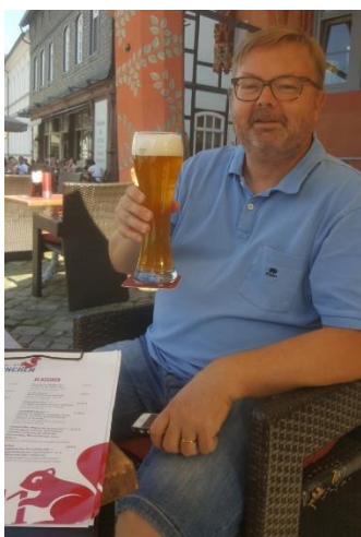
🙄 HEDE 🙄

😊 BRAY er debutant i turneringen, dog med en velkendt tipper bag, så favoritværdigheden var på BRAY ´s side her i det interne opgør mellem to 3. divisionstippere. Modstanderen var HEDE der også debuterer i denne sæson. I den 1. kamp toppede BRAY med en fantastisk egenscore og HEDE kunne intet stille op og led et sviende nederlag og i den 2. kamp var BRAY også helt i top og HEDE fik igen en på hatten. Så en samlet storsejr til BRAY og en velfortjent billet til Pokalturneringens 2. runde 😊 HEDE fik i høj grad et HEDE-slag og røg ud af Pokalturneringen for denne gang 🙄