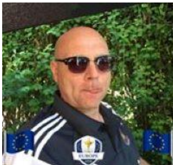
😊 MORAN 😊

LUFCMOT (3) – LUCKY (2): (6 – 4, 9 – 8):