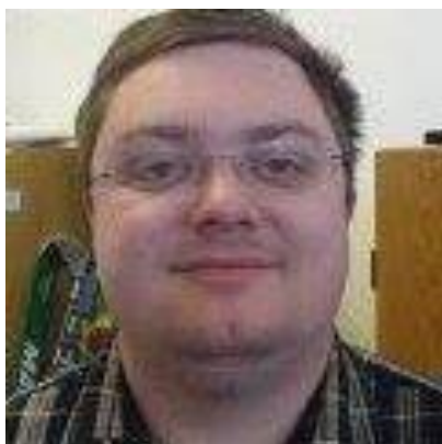
😊 LIONS 😊

😊 LIONS vandt dette opgør mellem to tippere fra den bedste række. LIONS røg ud i 2. runde i sidste sæson og har ingen særlige traditioner i Pokalturneringen. Modstanderen var veteran-tipperen LUND , der heller ikke har haft de bedste resultater i Pokal'en i mange år og lige som i sæson 2020 røg LUND også ud her i 1. runde i 2021. LUND kan dog se tilbage på en 3. plads i sidste århundrede i Pokalturneringen 1999. Efter uafgjort i den første kamp, kørte LIONS stille og roligt to beskedne sejre hjem og fik hermed billet til Pokalturneringens 2. runde 😊 LUND må prøve at ændre lidt i taktikken, - men Pokal'en er forbi for LUND for denne gang 🙄