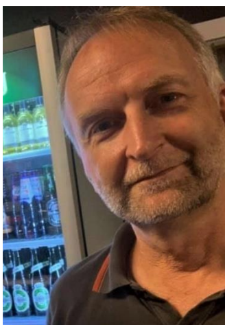
🙄 CULOPIP 🙄

😊 MARSCHA der for det meste huserer i toppen af den bedste række, er tidligere Pokal-Mester i 2017 og har dermed papirerne i orden, men måtte dog i sæson 2020 se sig slået ud af Pokal'en allerede i 1. runde. Her i sæson 2021 mødte MARSCHA den debuterende tipper signatur CULOPIP, der dog for mange år tilbage, har en fortid i Lund's under en anden signatur. MARSCHA var dog udset til at være absolut favorit, men efter den 1. kamp hvor CULOPIP vandt med en beskedne score, øjnede mange en lille sensation, men MARSCHA der er sikkerheden selv, slog igen i den 2. kamp og så var stillingen lige igen og så lige en enkelt uafgjort kamp, hvorefter MARSCHA i den 4. kamp tog stikket og den samlede sejr hjem og hermed en billet til Pokal'ens 2. runde 😊 CULOPIP der var kommet på en svær opgave, kæmpede fint, men må se i øjnene, at det er slut i Pokalturneringen 2021 her efter 1. runde 🙄