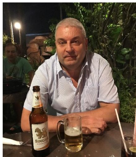
🙄 NUSER 🙄