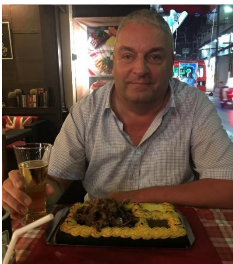
🙄 BAMSE 🙄

😊 MORAN er tilbage i Pokalturneringen efter 34 års fravær og modstanderen var BAMSE fra den næstbedste række. På papiret var BAMSE, med de fine papirer fra Pokalturneringen 2010, hvor det blev til en 2. plads, klar favorit. BAMSE nåede også helt frem til 3. runde i sidste sæson. Men MORAN viste sig bedre end forventet og efter to forsigtige uafgjorte kampe, stor-sejrede MORAN i den 3. kamp, men efter endnu en uafgjort kamp, var det BAMSE der hev en beskeden sejr hjem og så det helt lige igen. Men i den 6. kamp havde BAMSE ikke flere kræfter og trods en hæderlig score, var MORAN lige en tand bedre og dermed hev MORAN en overraskende men fortjent sejr hjem. Belønningen er en billet til Pokalturneringens 2. runde 😊 BAMSE må noget slukøret forlade Pokalturneringen for denne gang 🙄