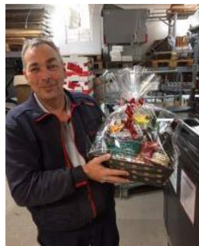
🙄 LUCKY 🙄