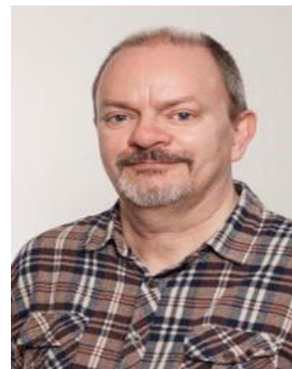
😊 SPVK 😊

Der var et enkelt internt opgør mellem tippere fra 3. division: