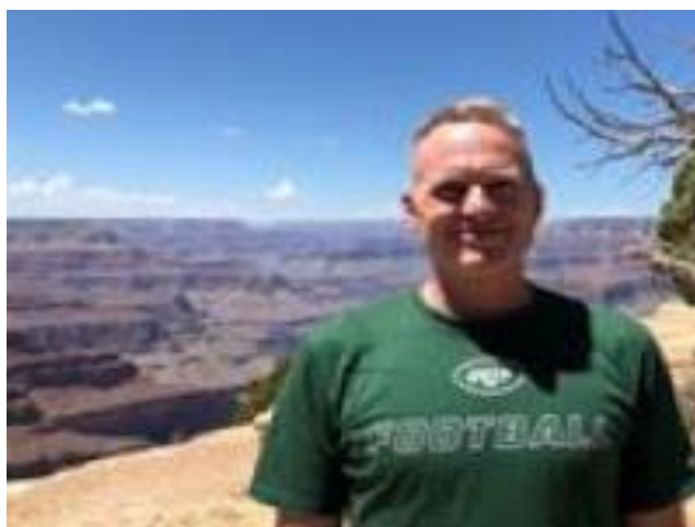
😊 MARSCHA 😊