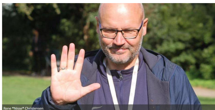
😊 NISSE 😊