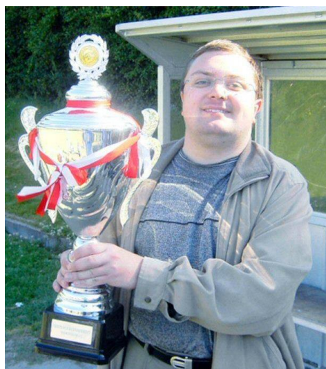
😊 FUTTE 😊