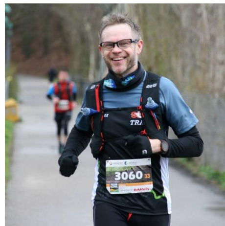
🙄 NIELSEN 🙄

AYA (2) – MAGPIES (3): (4 – 6, 8 – 8, 4 – 4, 2 – 4):