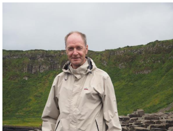
🙄 LUND 🙄

MIKI (1) – FRYDKÆR (1): (4 – 6, 8 – 10):