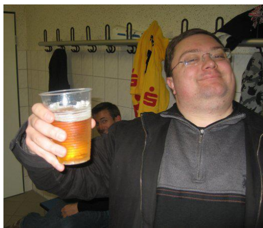
🏆 TOFFEE 🏆