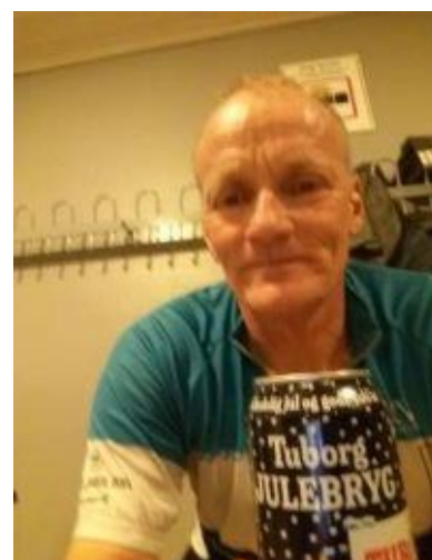
🙋 AGGER 🙋