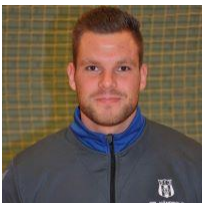
🙄 MIKI 🙄

😊 FRYDKÆR veteran og Danmarks mester 2020 er jo kommet lidt skidt fra start her i den nye sæson, hvor FRYDKÆR frister en placering som absolut bundprop i den bedste række. Så mødet med oprykkeren MIKI fra den samme række var pludselig meget åbent, idet begge tippere huserer i bundfeltet og begge tippere har en tendens til spændende tipstegn nu og da. Begge tippere røg ud af Pokalturneringen 2020 i 2. runde og ingen af de to tippere figurerer på Pokalturneringens Top 3 – Evighedstabel. Der var dog ingen tvivl om sejren her, idet FRYDKÆR vandt meget sikkert i to opgør og dermed er videre til Pokalturneringens 2. runde 😊 MIKI må takke af i Pokal'en for denne gang 🙄