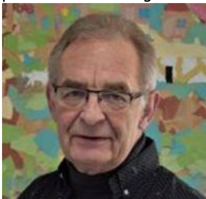
😊 BRULA 😊

😊 BRULA og SCHØN er begge placeret i Danmarksturneringens 2. division og begge tippere er kendt for en frisk tilgang til tipstegnene. Ingen af de to har deres signatur på Pokal-turneringens Top 3 – Evighedstabel og begge forlod Pokalturneringen 2020 i 2. runde, så det var på forhånd et meget åbent opgør. BRULA lagde dog ud med en beskeden sejr i den 1. kamp og havde dermed et godt oplæg til den videre duel. Da begge tippere havde en super-score i den 2. kamp, måtte de begge nøjes med uafgjort, men så fik BRULA det afgørende stød ind i den 3. kamp, som blev vundet beskedent, men det var nok til at få den samlede sejr i hus og dermed fik BRULA en billet til Pokalturneringens 2. runde 😊 SCHØN der i sæson 2020 havde en formidabel enkel-række, er her først i den nye sæson ikke oppe på samme niveau og må vinke farvel til Pokalturneringen 2021 🙋