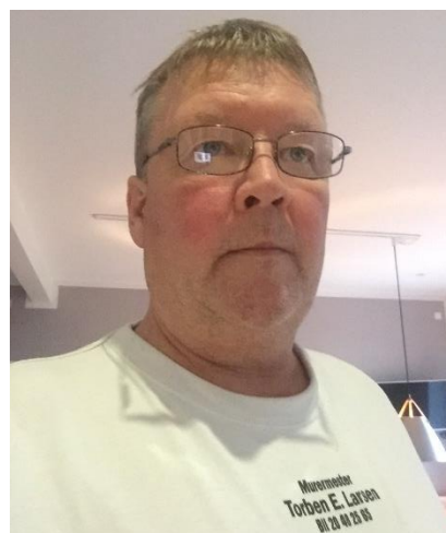
🙄 MURER 🙄