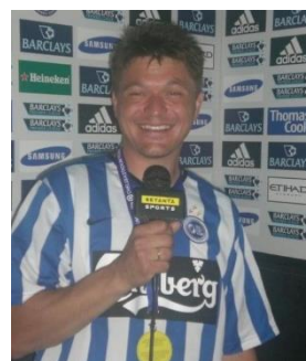
😊 ANDERUP 😊