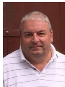
😞 NUSER 😞