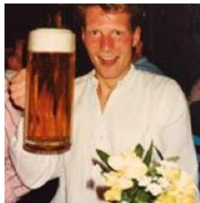
😊 SCHØN 😊