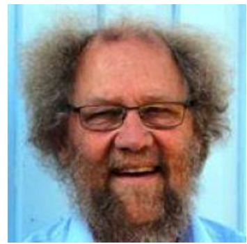
😊 STEAM 😊