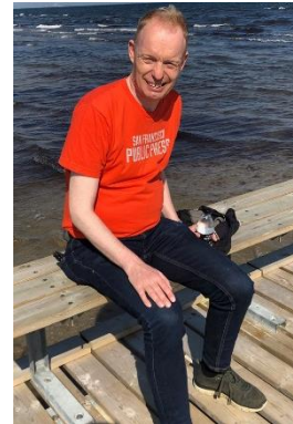
😊 FOX 😊