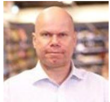
😊 GALWAY 😊