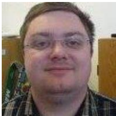
TOFFEE / FUTTE 😊

😊 KINKS blev en sikker vinder af denne pulje og KINKS har da også vundet 1. Divisions Cup'en i 1998 og har præsteret ikke mindre end tre 2. pladser i årene 1997, 2002 og 2012. TOFFEE der ikke tidligere har gjort sig bemærket i Divisions Cup'en, fulgte godt med og besatte en meget sikker 2. plads i puljen. På 3. pladsen signaturen SENIOR , der har imponerende "papirer" i Divisions Cup'en, med tre imponerende Divisions CUP – mesterskaber fra 2017 og 2018 og tilbage i 2009, en 2. plads i 2013 og en 3. plads i 2013. På 4. pladsen FUTTE der også allerede før sidste kamp havde sikret sig en billet til mellemrunden. Den forsvarende Divisions Cup – Mester 2019 FOREST på 5. pladsen, der med den fine egenscore var sikret før sidste kamp. MALTHE på 6. pladsen nåede også lige med til Mellemrunden 😊