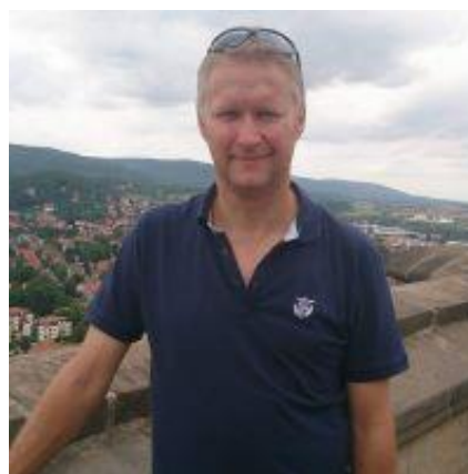
KINKS / FOREST 😊