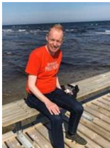
🙄 FOX 🙄