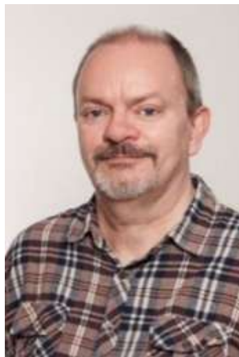
🙄 SPVK 🙄