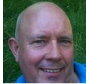
😊 ÅZÆTZØW 😊

😊 FLINCA blev slået ud af MURER i 1. runde i sidste sæson, men FLINCA var her i 2026 så heldig at være oversidder i 1. runde, så allerede en forbedring. FLINCA skal i 2. runde møde HARRY som FLINCA ligger side om side med i den bedste Ligas nederste halvdel 😊