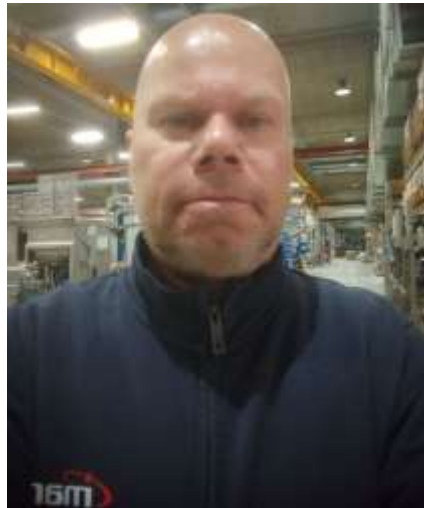
😊 CORK 😊