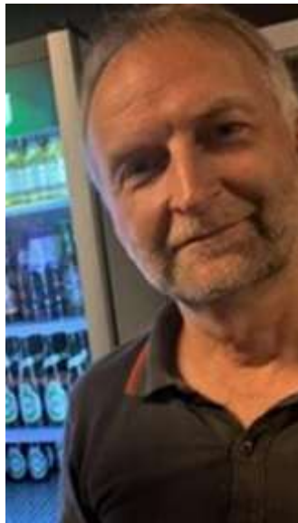
😊 CULOPIP 😊