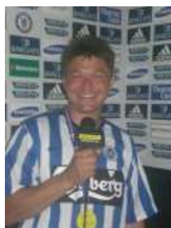
👁️ Anderup 👁️