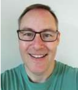
😊 FLINCA 😊

Oversiddere i 1. runde: FLINCA (1), HARRY (1), FUTTE (1), ÅZÆTZØW (3):