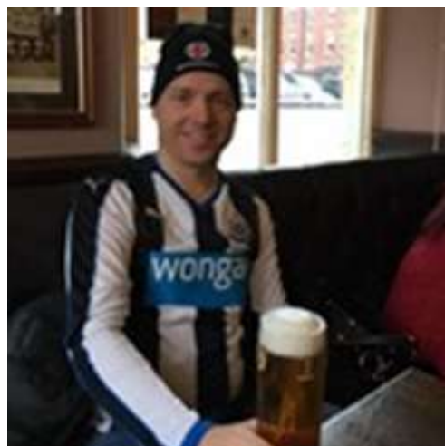
🙄 MAGPIES 🙄