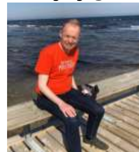
👁️ Fox 👁️