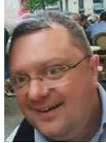
😊 FUTTE 😊