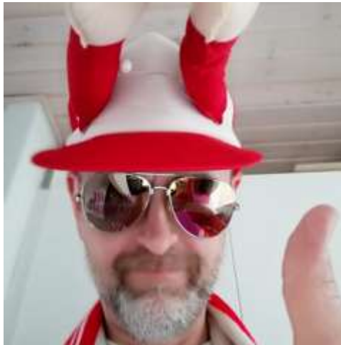
😊 SEBJOH 😊